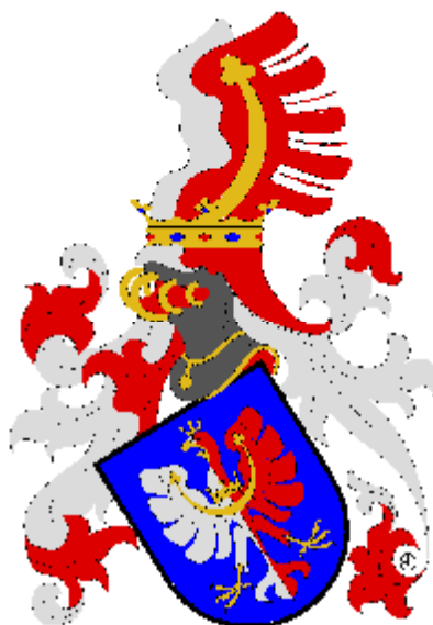
Kolowrat Krakowský Liebssteinský Původní i současní hraběcí majitelé zámku v Rychnově nad Kněžnou.