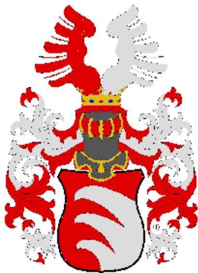
Kinský z Vchynic a Tetova Původní i současní hraběcí majitelé Nového zámku v Kostelci nad Orlicí.

(Barevná vyobrazení později naleznete na http://heraldika.drozd.info/hag/kostelec_nad_orlici.htm ).