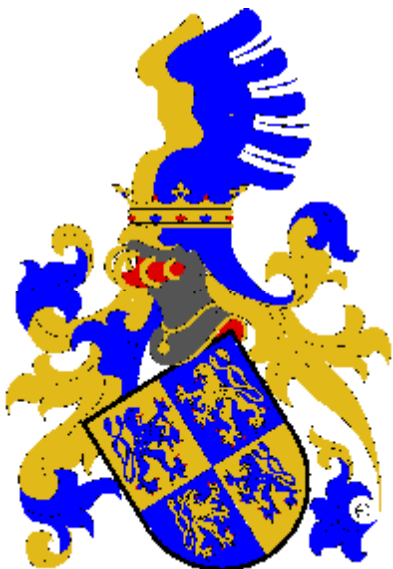
Brtnický z Waldsteina

(Vyobrazení ve větším rozlišení později naleznete na http://heraldika.drozd.info/hag/jihlava.htm ).