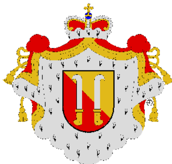
František kardinál z Dietrichsteinu Olomoucký biskup od roku 1599 do roku 1636. Vyobrazení erbu rodu knížat z Dietrichsteinu.