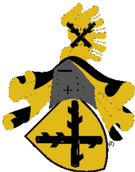
biskup Jindřich III. Berka z Dubé Olomoucký biskup od roku 1326 do roku 1333. Vyobrazení erbu rodu pánů Berků z Dubé.

(Vyobrazení ve větším rozlišení později naleznete na http://heraldika.drozd.info/hag/vyskov.htm ).