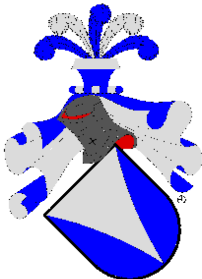
biskup Karel II. z Lichtenstein-Kastelkornu Olomoucký biskup od roku 1664 do roku 1695. Vyobrazení původního erbu rodu hrabat z Lichtenstein-Kastelkornu.