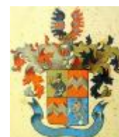
Nádherný z Borutína