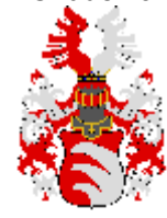
Kinský z Vchynic