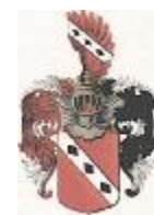
Mladota ze Sopolisk