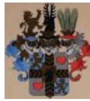
Hrubý z Gelenj