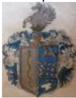
Serényi de Kis-Serény